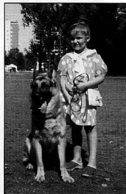
KARAT z Borku Zwierzynieckiego 4 bardzo dobry w klasie użytkowej.