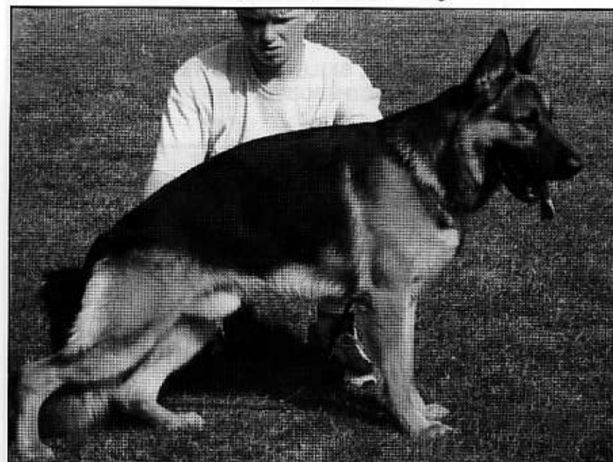
Inbred: URAN v. Wildsteiger Land (4,4-3,4), PALME v. Wildsteiger Land (5,5,5-4,5)

ur. 24.07.1995, SchH.1, HD - noch zugelassen