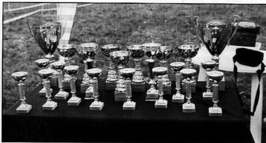
Puchary wręczane na ringu owczarków niemieckich. Nagrodzono pierwsze dwa psy w każdej klasie, a także Zwycięzców Wystawy.

Wyniki podano na podstawie materiałów otrzymanych z Oddziału w Krakowie.