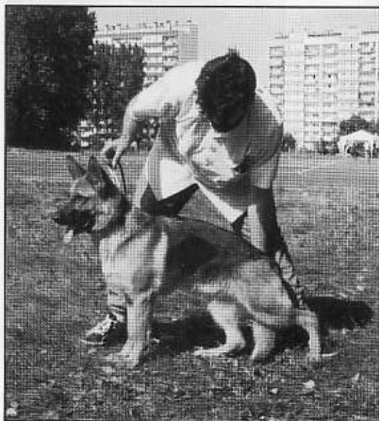
JETTA v. d. Wienerau. 2 doskonała w klasie młodzieży.

2 D – JETTA v. d. Wienerau (NERO v. Hirschel, WARINKA v. d. Wienerau), wł.: Andrzej Piwowar