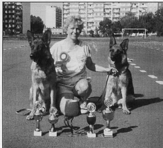
Z lewej BINGO Matador, Zwycięzca Juniorów, z prawej BONA Matador, Zwycięzca Juniorów, Zwycięzca Wystawy, Zwycięzca Rasy, CWC.

1 D, Zwyc.Juniorów, Zwyc.Wystawy, Zwyc.Rasy, CWC – BONA Matador (LASER v. Platoon, ILZA De-Bes), wł.: Mirosława Szmyd