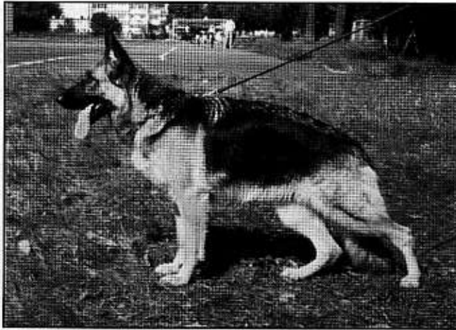
BASTA z Kojca Elbikame. 1 doskonała, CWC w klasie otwartej.