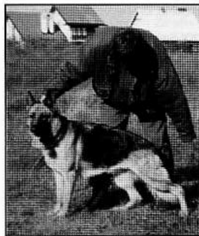
VENA z Krywlan. Zwyc.Wystawy, Zwyc.Rasy, CWC.